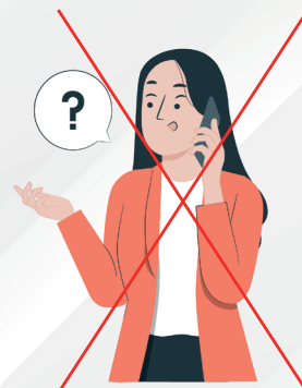
Пользоваться мобильными устройствами